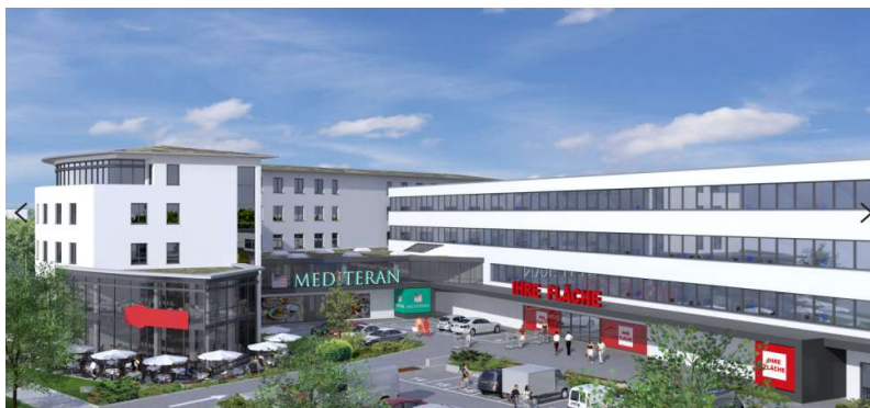
Büro- und Gewerbekomplex der Schwaiger Group im Gewerbegebiet Am Moosfeld

Heute präsentiert sich der Gebäudekomplex in erstklassigem Zustand. Moderne Büros, funktionale Großhandelsverkaufsflächen und kundenfreundliche Liefer- und Ladezonen sorgen für hohe Aufenthalts- und Arbeitsqualität. Die Mieter, darunter auch die BayWa AG, der Bürofachmarkt Staples sowie mehrere hochspezialisierte Fachbetriebe wissen die Maßnahmen sehr zu schätzen und empfangen heute ihre Kunden und Geschäftspartner mit Stolz in ihren Räumlichkeiten.