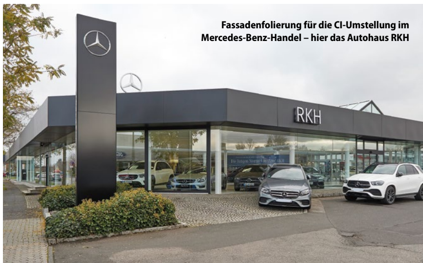
Fassadenfolierung für die CI-Umstellung im Mercedes-Benz-Handel – hier das Autohaus RKH

S. Ude: Definitiv ja! Die Einsatzmöglichkeiten von Folienbeschichtung sind vielfältiger, als man vielleicht denkt. Für In-